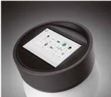
Kısa ve kolay kullanımlı arayüzü