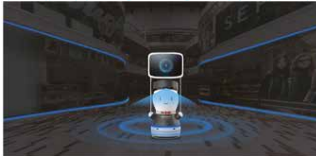
Tam otonom konumlandırma ve navigasyon