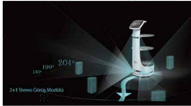
Tam Otonom Konumlandırma ve Navigasyon