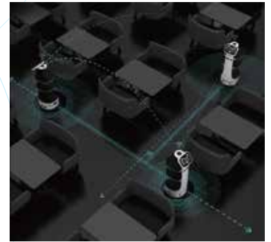
Çoklu Robot İşbirliği